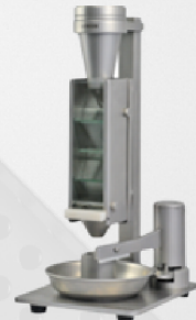
Volúmetro de scott