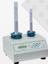
Compactador de polvos