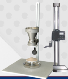
Analizador de ángulo de reposo