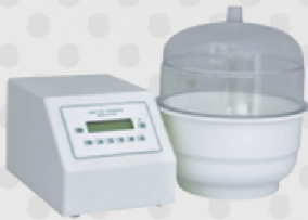
Probador de hermeticidad