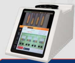
Punto de fusión

CONTAMOS CON VARIOS MODELOS Y ACCESORIOS PARA SUS EQUIPOS